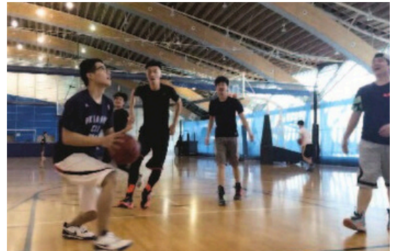
Club de Baloncesto