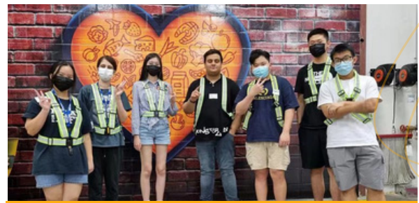
Banco de Alimentos (Food Bank)