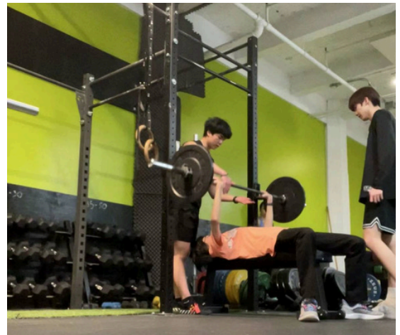
Club de Gimnasio