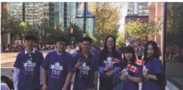
Celebración del 150 aniversario de Canadá

Los estudiantes participan activamente en numerosos eventos de voluntariado a gran escala en Vancouver, como la celebración anual de Canada Day, Vancouver Marathon, Vancouver International Children's Festival, Vancouver Cherry Blossom Festival, Vancouver Dragon Boat Festival, festivales de música, desfiles navideños y las tradicionales ventas benéficas de árboles de Navidad, entre otros.