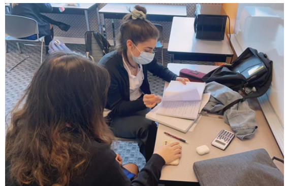
Club de Apoyo Académico