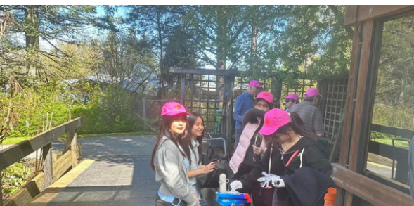
Vancouver Cherry Blossom Festival