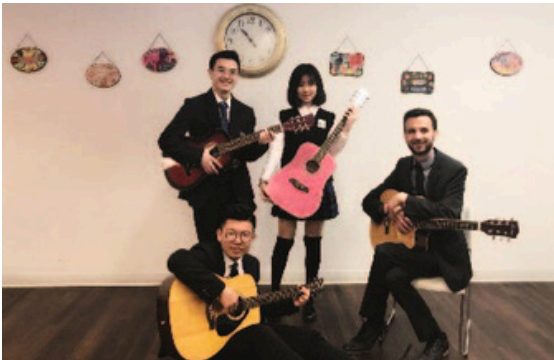
Club de Música