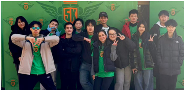
St. Patrick's Day