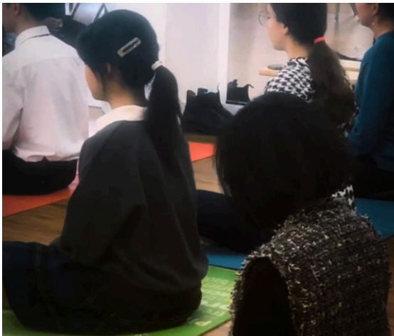
Club de meditación

Los profesores también ofrecen diversas actividades extraescolares, como debate, voluntariado, concursos, tutorías extraescolares, guitarra y meditación.