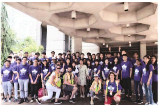
Club de Voluntariado