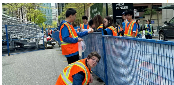
BMO Vancouver Marathon